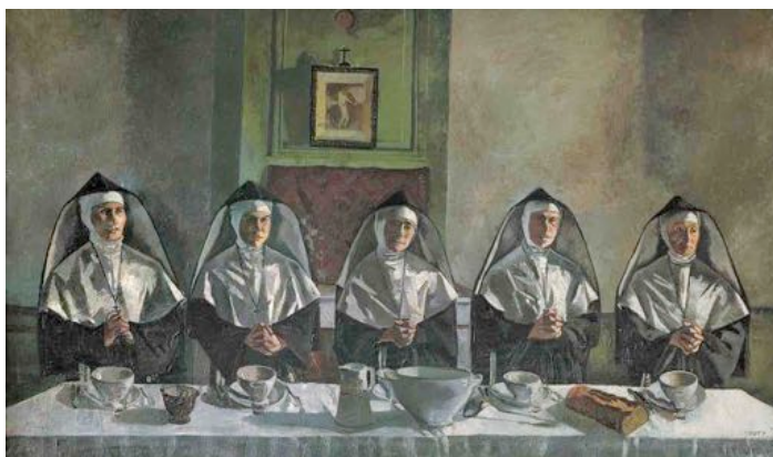
Le Bénédicté, 1941 Huile sur toile, 226 x 363 cm