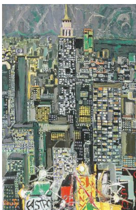
New York, 1977 195 x 130 cm

Relations avec les médias Myriam Couty Tél : 04 72 42 20 00 musee@museejeancouty.fr